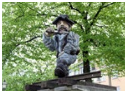
3. Statyn Rallaren