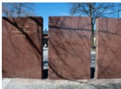
4. De tre monoliterna