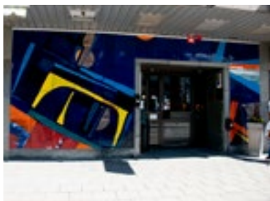
19. Väggmålning i emalj

Konstnären Lennart Kindgren arbetade i stor utsträckning med skulptural monumentalkonst och emaljmåleri för offentlig miljö, och skapade i slutet av 1960-talet den stora abstrakta väggmålningen i emalj, vid ingången till Hotell Stinsen på Stortorget.