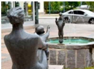
5. Fontän med staty

Elsie har även gjort konstverk nummer 2, Statyn 17 år.