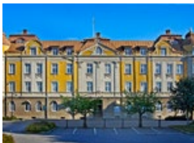
7. Kommunhuset

På 1950-talet byggdes huset om till förvaltningshus.