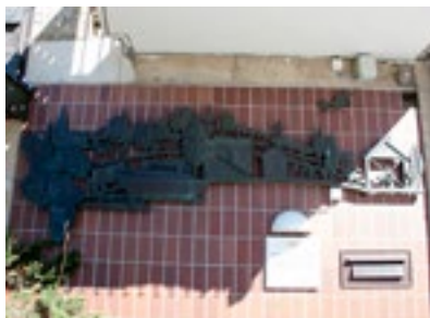
24. Konstverket - Brevets väg

Under 2000-talet revs hus nummer 3, men nummer 4 är återställd och Kronan nummer 5 håller på att renoveras.