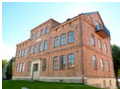
22. Östra skolan