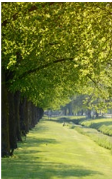
14. Allégatan och Rösättersbäcken