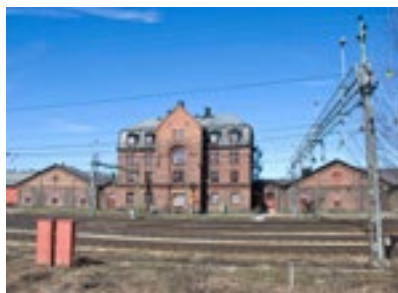
11. Boställshus och Lokstallar