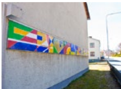
13. Konstverket Festremsan