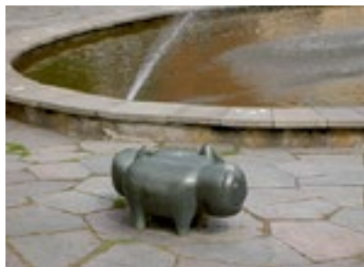
16. Park med djurstatyer