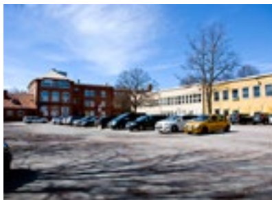
12. Västra skolan

Längs med gatan rinner den centrala Rösättersbäcken. De flesta kallar emellertid bäcken för Puttlabäcken eller Puttlis.