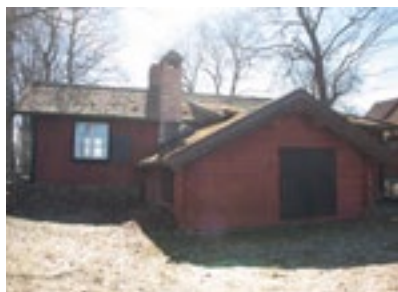
10. Bohmans Smedja