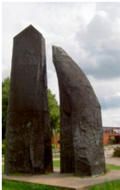
15. Skulpturen Tidig form