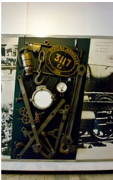
6. Konstverket Loket

Först 1994 kom konstverket tillbaka till Hallsberg och fick sin nuvarande plats.