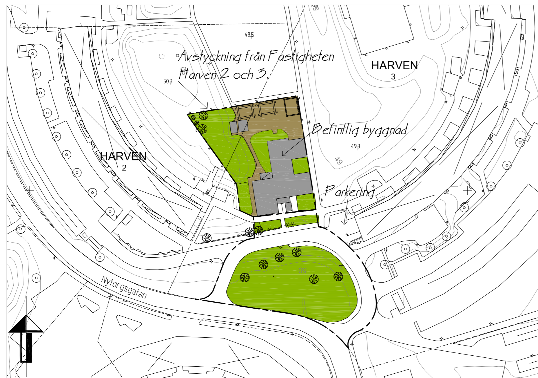
Illustrationskarta. Originalhandling ritad i A2 format och skala 1:1000. Förminskad ritning hänvisas till skalstock