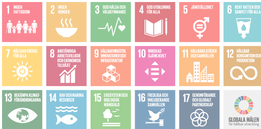
De sjuutton globala målen för hållbar utveckling. Illustration: Regeringskansliet/FN