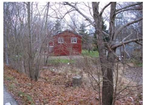
Miljöer från området