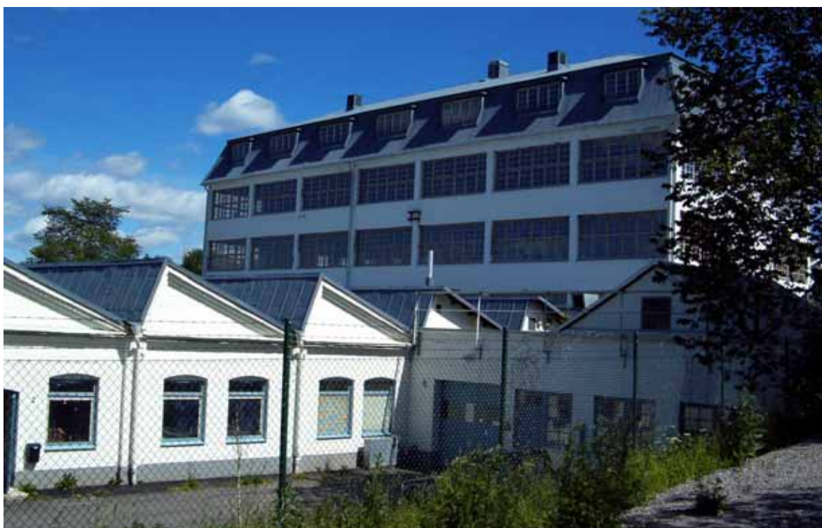
F d skofabriken