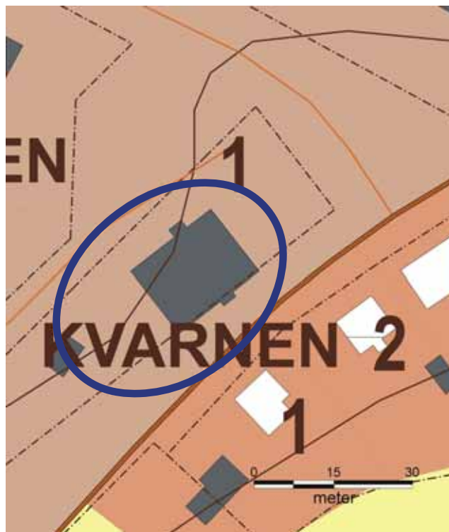
7 b Hallsbergs kvarn, kv Kvarnen 1, Kvarngatan 1

Byggnaden underhålls med traditionella byggnadsmaterial. Fasaddetaljerna bevaras och vårdas.