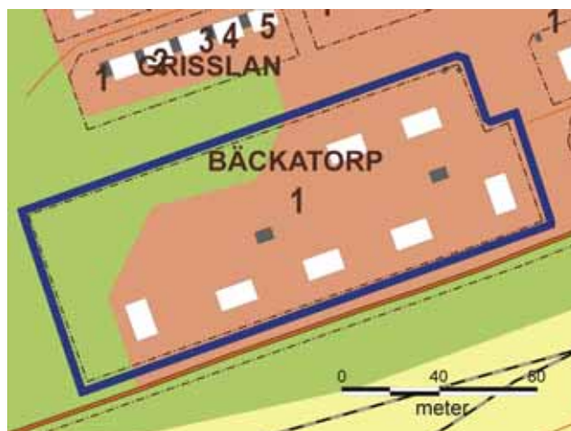
15 a Kv Bäckatorp 1