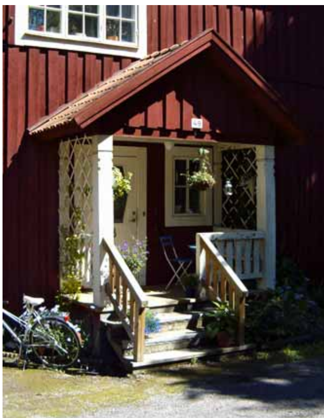
En av områdets förstukvistar

Husen underhålls med ursprungliga material och metoder. Moderniseringar bör ske försiktigt. Ursprungliga fönster får inte bytas, liksom ej heller tak- och fasadmateriäl. Ett skydd i detaljplan rekommenderas.