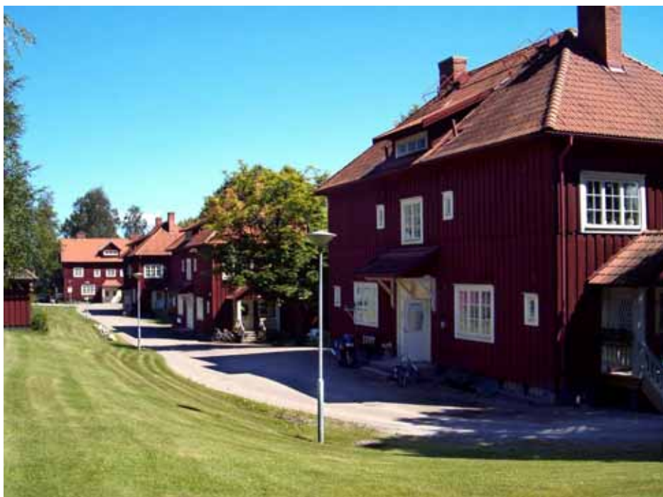
De fd personalbostäderna vid Bäckatorp

äldre modell. Portarna är dock bytta vid en modernisering under 1960-talet.