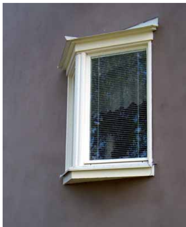
Burspråk på södergaveln, Fredsgatan 4

Sedan inventeringstillfället har samtliga bostadshus i området renoverats, även det ovan nämnda Vinkeln 5. Husen i kv Axet har genomgått en något varsammare renovering än de andra kvarteren. Här har exempelvis de gamla ekdörrarna renoverats till skillnad från de andra husen där opassande lättmetalldörrar satts in. I Vinkelparken tillkom vid 1990-talets slut ett flertal garagebyggnader. Den f d livsmedelsaffären vid Nytorget är tillbygd och inrymmer idag andra verksamheter.