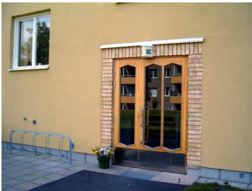
En av de omsorgsfullt utformade portarna i kv Axet, Fredsgatan 6