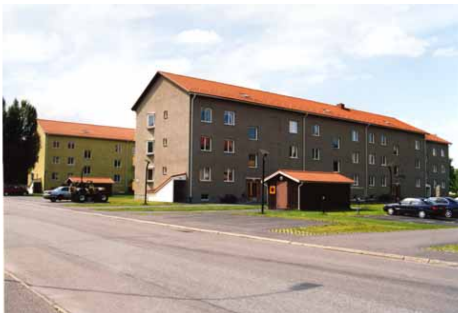
Kv Axet 3 och 2, Fredsgatan 4 och 6

bilparkeringar p g a det lilla antal privatbilar som fanns när husen byggdes. Det hade dock varit bättre med en annan markbeläggning än asfalt.