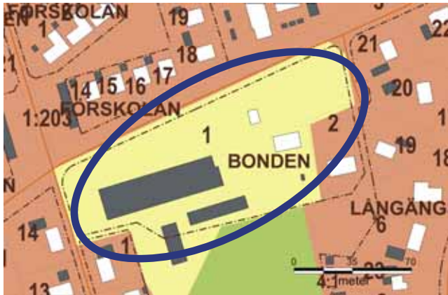
1 c Kv Bonden 1, Långängens gård, Ängvaktarvägen 6

Gården har lokalt kulturhistoriskt värde som en av de kvarvarande gårdar där ett lantligt liv levdes parallellt med det mer urbana livet i stations-samhället.