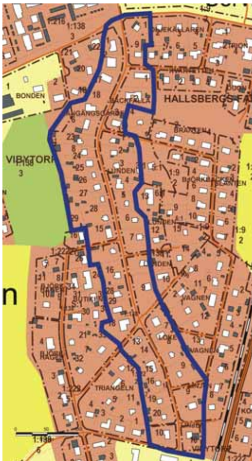
1 a Långängsvägen

Den gleasa bebyggelsekaraktären med styckebyggda hus i gatans närhet bör inte förändras. De enskilda husens ursprungliga karaktär och detaljer bör återställas i möjligaste mån och uthusen bevaras.