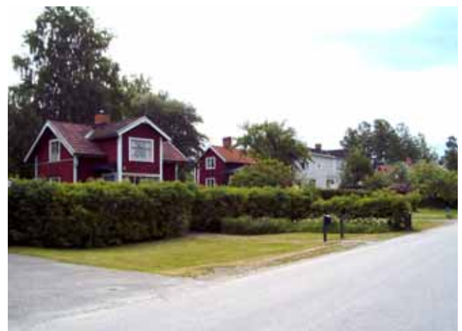
Långängsvägen 21, 23, 25