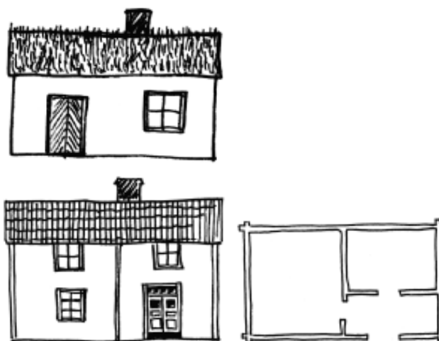
Enkelstuga i en våning (överst) och i två våningar, en så kallad Närkestuga (nedan tv) samt planskiss (nedan th).

Enkelstuga -byggnad bestående av ett rum med eldstad, "stugan", samt förstuga och en liten kammar. De blev mycket vanliga i denna del av landet under 1700-talets senare del och 1800-talets första hälft. Under 1800-talet byggdes många av enkelstugorna på med en andra våning. Det var nu de för Närke så karaktäristiska korta och höga stugorna blev framträdande i landskapsbilden, de