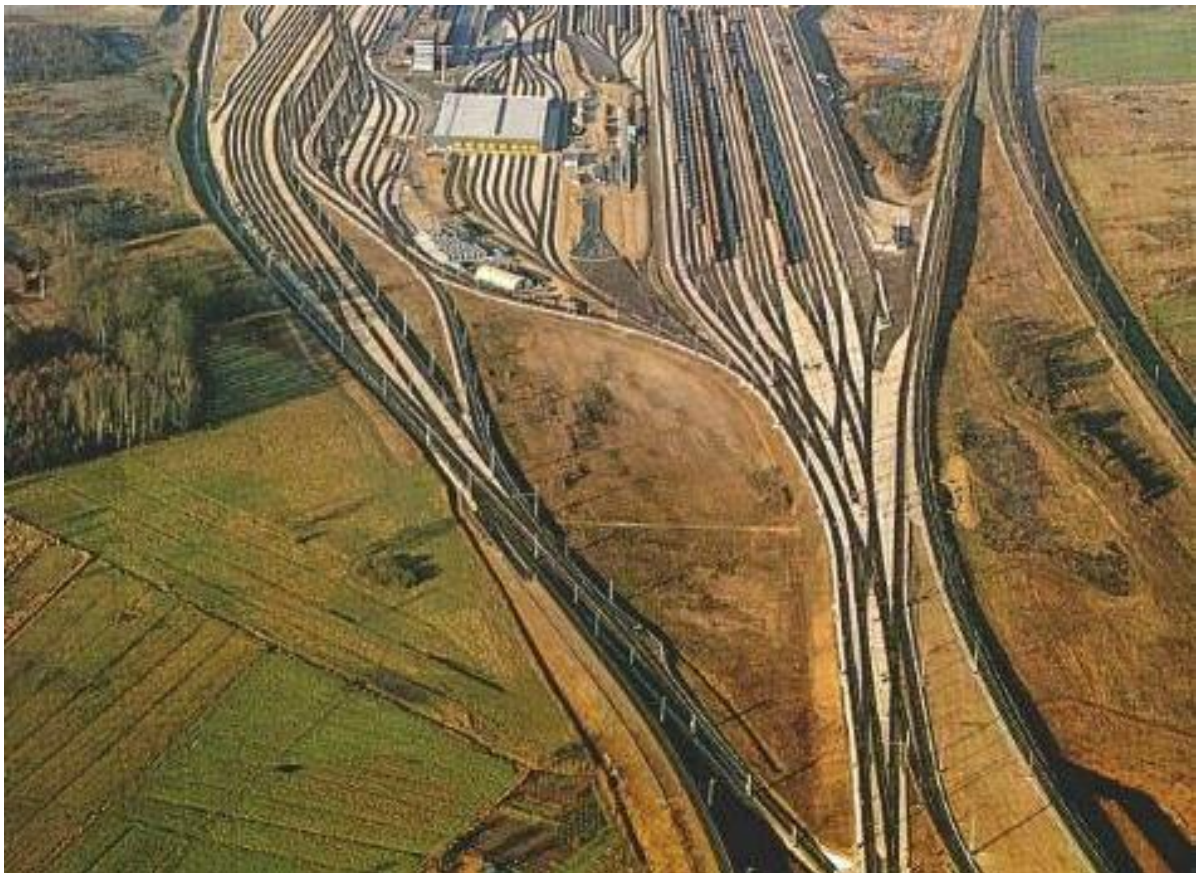
Verkstadsområde Maschen, Hamburg

Utformningen av utjämningsmagasinen anpassas i första hand till disponibla ytor vid exploateringen. Mellan spåren kommer stora ytor att finnas tillgängliga för magasinen. Se bild nedan som visar hur ett område med verkstäder, liknande den planerade, kan se ut (Maschen, Hamburg).