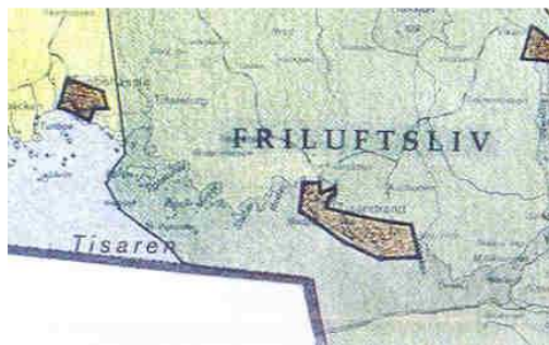
Utdrag ur översiktsplanen

I översiktsplanen är planområdet utlagt som ”fritidsområde med detaljplan eller områdesbestämmelser”.