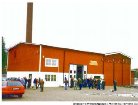
Dragslag nr 100rensanslaggropen i Pålshede den 12 september 2001