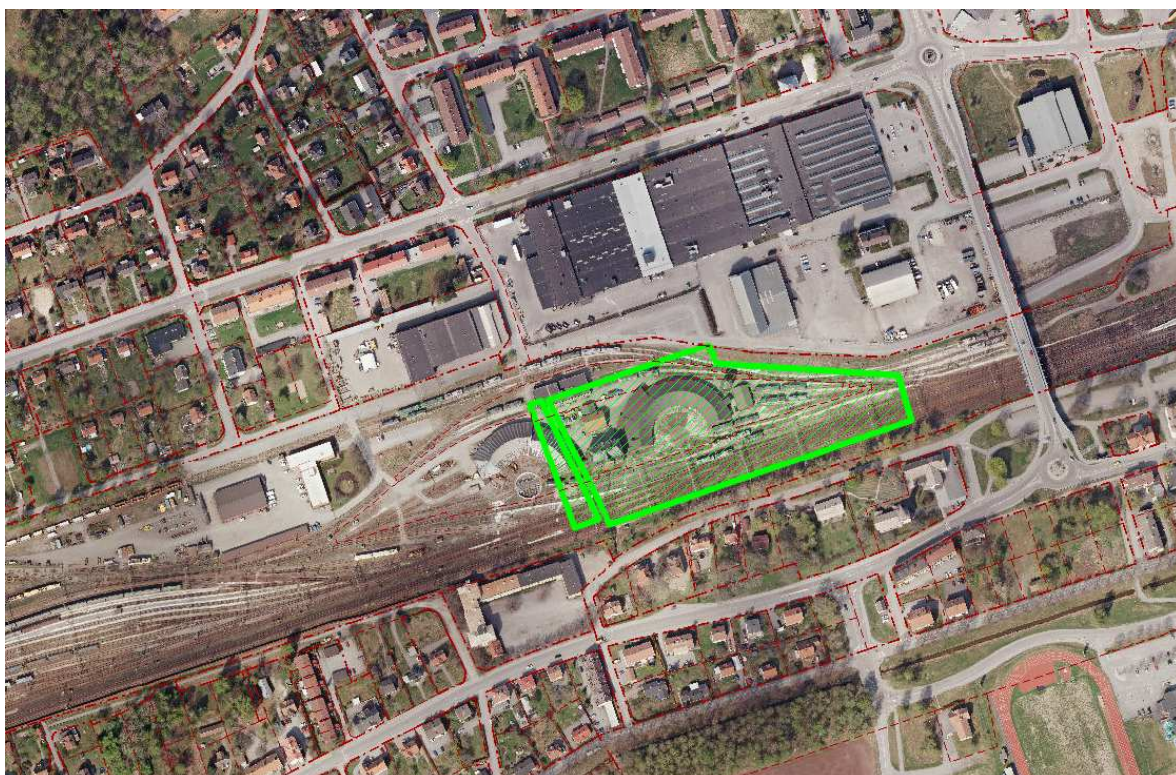
Figur 4 De gröna rasttrade ytorna är de delar som återstår av den gällande stadsplanen från år 1923.