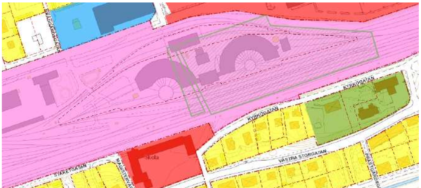
Figur 2 Bilden är ett utdrag ur den fördjupade översiktsplanen för Hallsbergs tätort. Lila område, kommunikationsanläggning. Det gröna rasterade område är det område som återstår av 1923 års stadsplan som kommer att upphävas.

Hallsbergs kommuns översiktsplan med fördjupningar av kommunens samtliga tätorter antogs av Kommunfullmäktige i Hallsbergs kommun den 16 maj 2011. Enligt den fördjupade översiktsplanen för Hallsbergs tätort är området utpekad som område för kommunikationsändamål